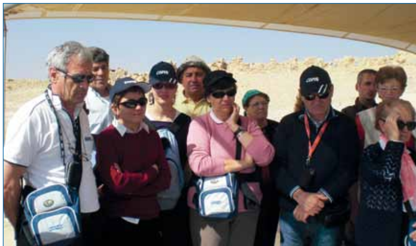
Il Gruppo AVIS di Montagna in Terrasanta