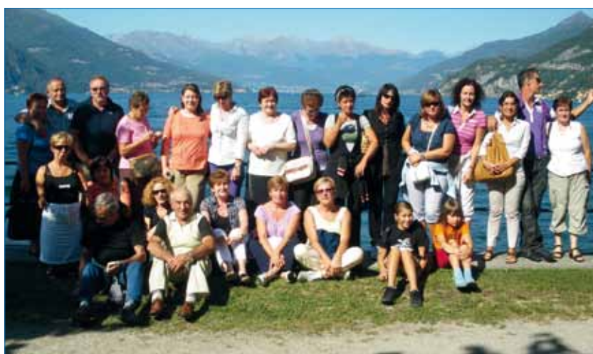
La Sezione AVIS di Poggiridenti a Bellagio